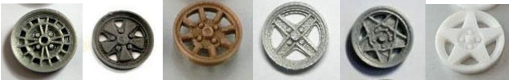
MustangAbarth MustangFuchs MustangMinilite Mustang 131 Mustang Ferrari MustangSpeedline

Aquestes llistes poden ser ampliades amb les aportacions de tots el participants, prèvia aprovació de la direcció de la cursa.