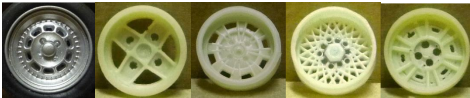
Avant Slot Alpine Evolution Slot 4 pals Evolution Slot Abarth Evolution Slot BBS Evolution Slot BMW

A-1-2 Tapa-cubs 1/32 comercialitzats per marques de slot autoritzats: