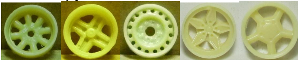
Evolution S. Minilite Evolution S. Targa Evolution S. Turisme Evolution S. Stratos Evolution S. Opel