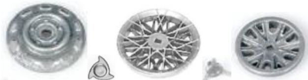
MRRC WI-36 MRRC WI-37 MRRC WI-35