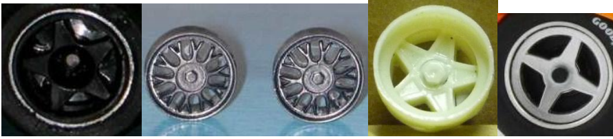
NSR 4 Spokes NSR BBS NSR Campagnolo Slot.it McLaren M8