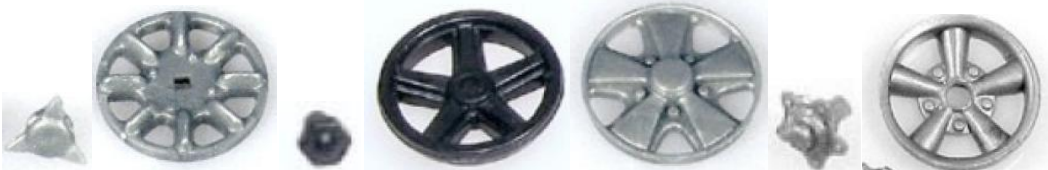
MRRC WI-37 MRRC WI-43 MRRC WI-44 MRRC WI-45