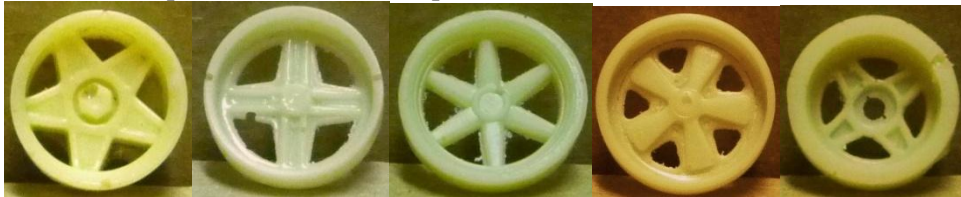
Evolution S. Campagnolo Evolution Slot Fiat Evolution Slot Flor Evolution S. Fuchs Evolution S. Mini