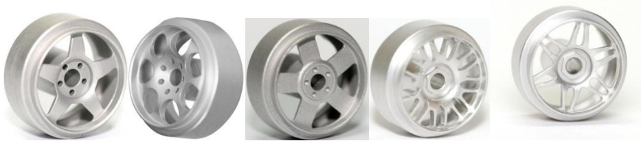
Sloting Plus America Sloting Plus Artic Sloting Plus Atlantis (1) Sloting Plus BBS Sloting Plus Monaco Excepte colors fosforescents.

A-1-1 Llantes d'alumini 1/32 comercialitzades per marques de slot autoritzades sense tapa-cubs :