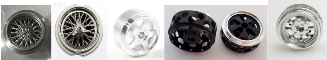
Mitoos Radios Top Slot Classic Scale Sebring SRC-OSC Fuchs SRC-OSC Minilite

A-1-2 Tapa-cubs 1/32 comercialitzats per marques de slot autoritzats: