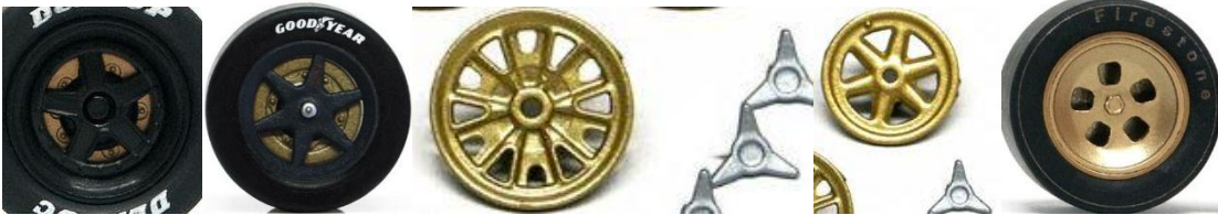
Slot.it Lancia LC2 Slot.it Sauber Slot.it GT40 MKI Slot.it GT40 MKII Slot.it 312 PB